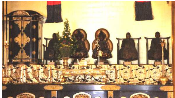
佛光寺 七高僧 ↑ ← 聖徳太子像

私たちの宗旨はと聞かれると、ほとんどの方が、「浄土真宗です」と言えると思いますが、では宗派まで聞かれた時、きちんと答えられるでしょうか。よく「東西どちら？」と言う方がありますが、西と言われるのが、私たちの「浄土真宗本願寺派」(西本願寺)で、東が「真宗大谷派」(東本願寺)です。しかし真宗十派と言われ、実は東西だけではありません。全国的に数で見ると東西で九割以上を占めますが、三重の高田派や、滋賀や福井ではその地に根付いた派もあります。